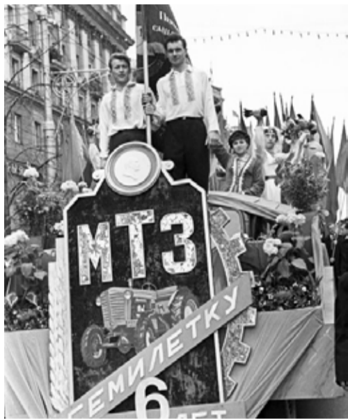
Колонна МТЗ на Первомайской демонстрации 1960 года в Минске