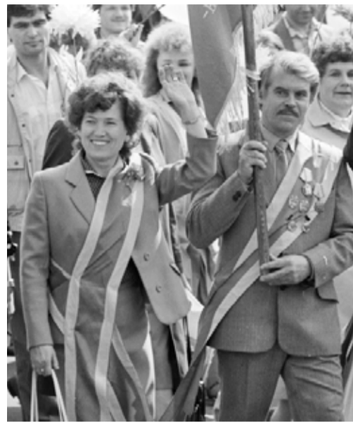
Праздничная демонстрация трудящихся в Минске 1 мая 1987 года