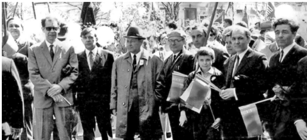
Рабочие и служащие МТЗ собрались на улице Грицевца для участия в Первомайской демонстрации, 1970-е годы

леваемости, травматизма, а также разработки мероприятий по их снижению.