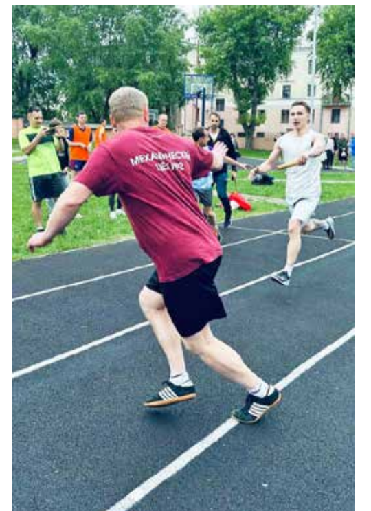
Автор выпуска Лада ДОЦЕНКО