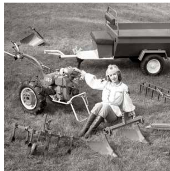
Подготовила Наталья МАРЦИНКЕВИЧ

Впоследствии выпуск мотоблоков был передан Сморгонскому агрегатному заводу, но культовый МТЗ-05 навсегда остался эталоном надежной техники. Он неизменно выручал тружеников как в полях, так и на личных подворьях. Отдельного упоминания заслуживает реклама того времени: очаровательная девушка в поле, а рядом — ее помощник-мотоблок.