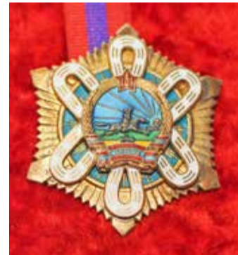
Орден «Полярная звезда»

Освоено производство нового вида продукции — рычага клапана для легкового автомобиля «Жигули».