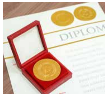
Большая золотая медаль выставки в Лейпциге