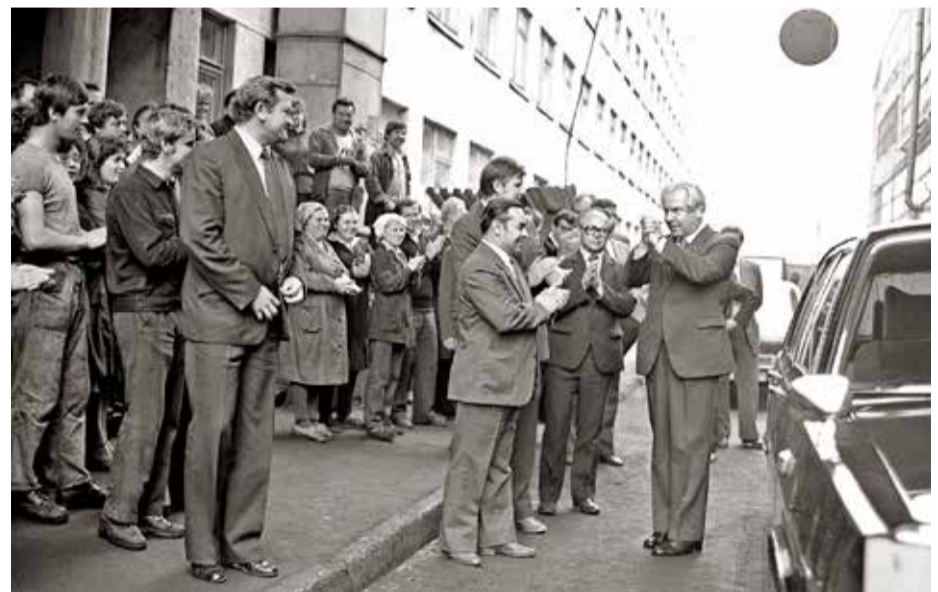
Первый секретарь ЦК КПБ Николай Слюньков на МТЗ, 1984 год