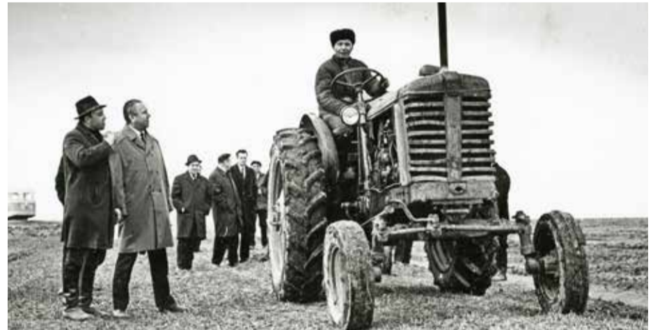
Николай Слюньков в колхозе «Большевик» Копыльского района, 1971 год. Первый колесный трактор МТЗ-2 забирают в Минск. Теперь он стоит на постаменте в сквере у центральной проходной