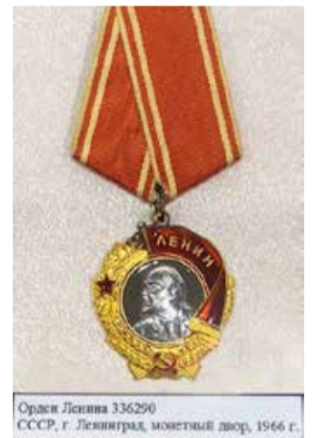
Орден Ленина 336290 СССР, г. Ленинград, монетный двор, 1966 г.

браженного на барельефе первого советского трактора «Фордзон-Путиловец». А с 1943-го и до распада СССР орден представлял собой знак, изображающий портрет-медальон В. И. Ленина, помещенный в круг, обрамленный золотым венком из колосьев пшеницы с серпом, молотом и красной звездой. Именно последний вариант, изготовленный на Ленинградском монетном дворе, выставлен в Музее