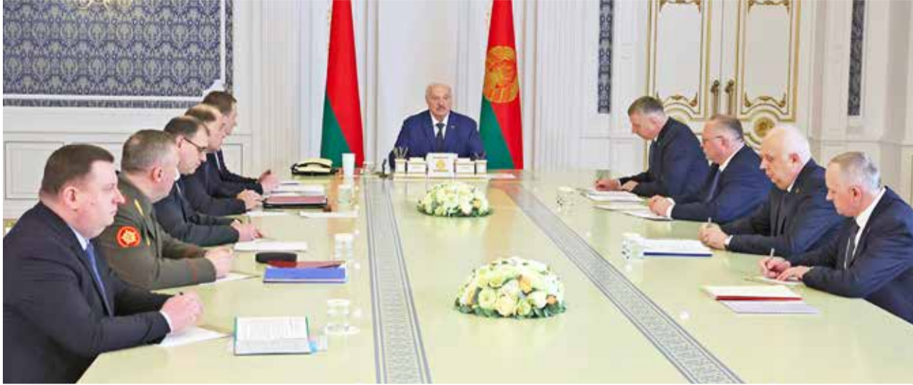
Президент Беларуси Александр Лукашенко провел совещание по вопросам оснащения Вооруженных Сил и развития военно-промышленного комплекса Республики Беларусь.

Глава государства отметил, что совещание носит закрытый характер, так как есть много конфиденциальных вопросов. «Но главный вопрос — как идет создание мощностей по производству боеприпасов? В будущем году, даже к концу этого года, мы должны иметь свои боеприпасы. Ходовые боеприпасы», — сказал Александр Лукашенко.