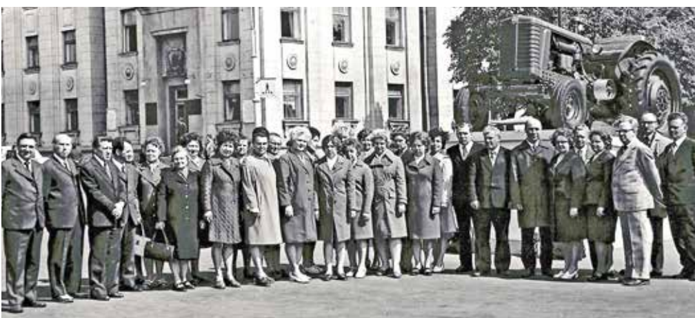
30-летие МТЗ, 1976 год