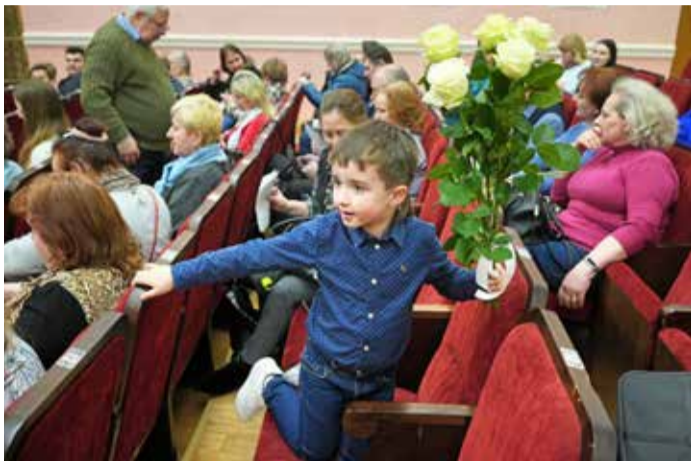
Цветы лучшему артисту