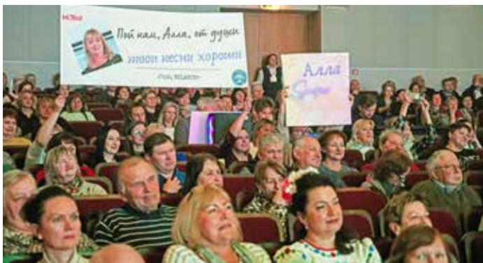
Группа поддержки МЗШ