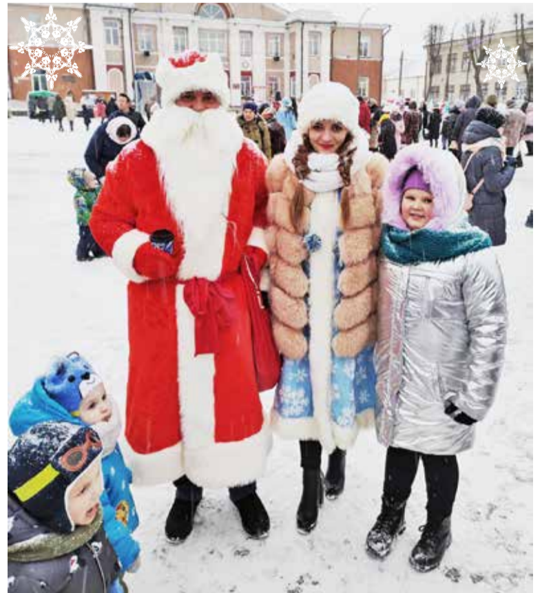
Сотрудники Лепельского ремонтно-механического завода примерили на себя образы Деда Мороза и Снегурочки

лишь половину стоимости. Сладкие подарки получили не только дети, но и все сотрудники. Кроме того, работников поощрили продуктовыми наборами.