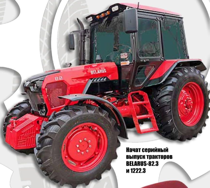
Начат серийный выпуск тракторов BELARUS-82.3 и 1222.3

Объем производства в 2021-м превысил 36 тысяч тракторов в год