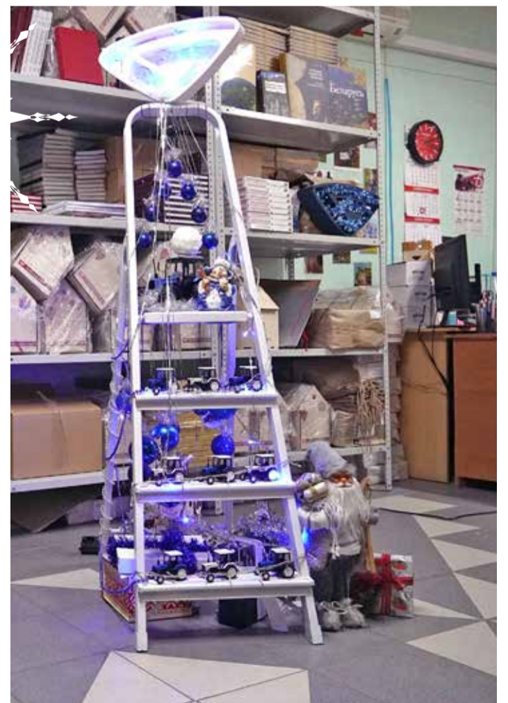
Та самая стремянка из УТПР МКЦ