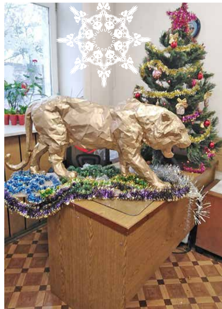
Удачи в 2022-м от сотрудников 1-й «литейки»