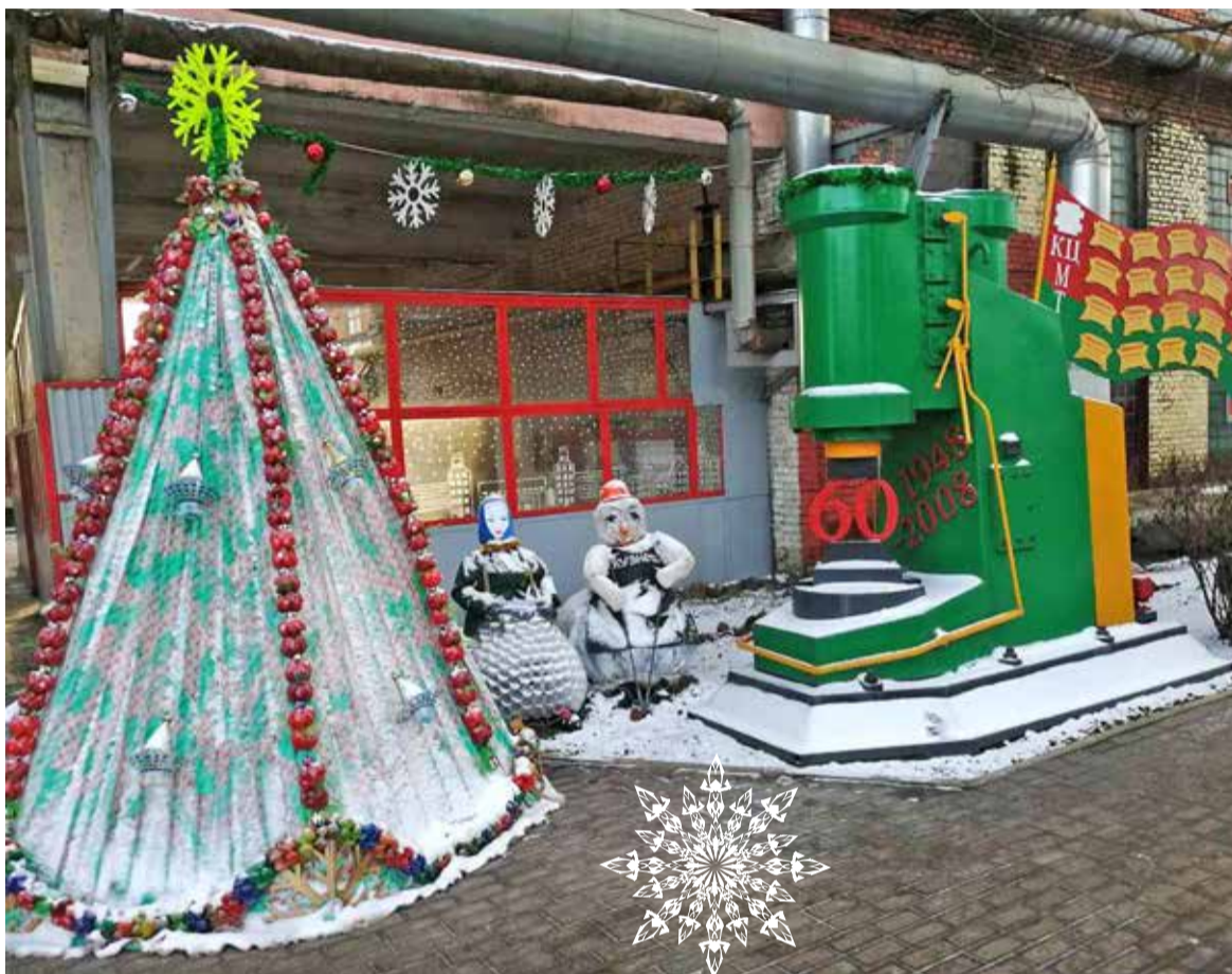
«Чудо новогоднее» от работников кузнечного цеха

Победители и призеры конкурса Среди управлений и отделов: 1 место — маркетинг-центр; 2 место — научно-технический центр УКЭР-1; 3 место — управление протокола и рекламы МКЦ. Среди цехов основного и вспомогательного производства: 1 место — кузнечный цех; 2 место — цех строительства и благоустройства; 3 место — литейный цех № 1.