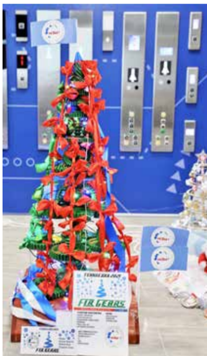
Техноелка от МЗШ

Сморгонское предприятие холдинга в канун праздника традиционно поздравляет многодетные семьи города. Благотворительная акция запланирована и в этом году. А для сыновей и дочек своих сотрудников на заводе организовали два утренника. Их провели в помещении Сморгонского районного центра культуры, арендованном специально для детских праздников. На новогодний корпоратив заводчане собрались 28 декабря. В каче-