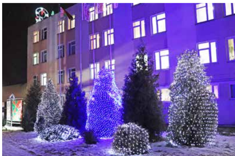
На ВЗТЗ к оформлению подошли креативно

Предприятие отлично подготовилось к празднику: заводские кабинеты украшены гирляндами, разноцветными шарами и искусственными елочками. Огонек для коллектива организовали с финансовой поддержкой профкома: работники внесли за праздник