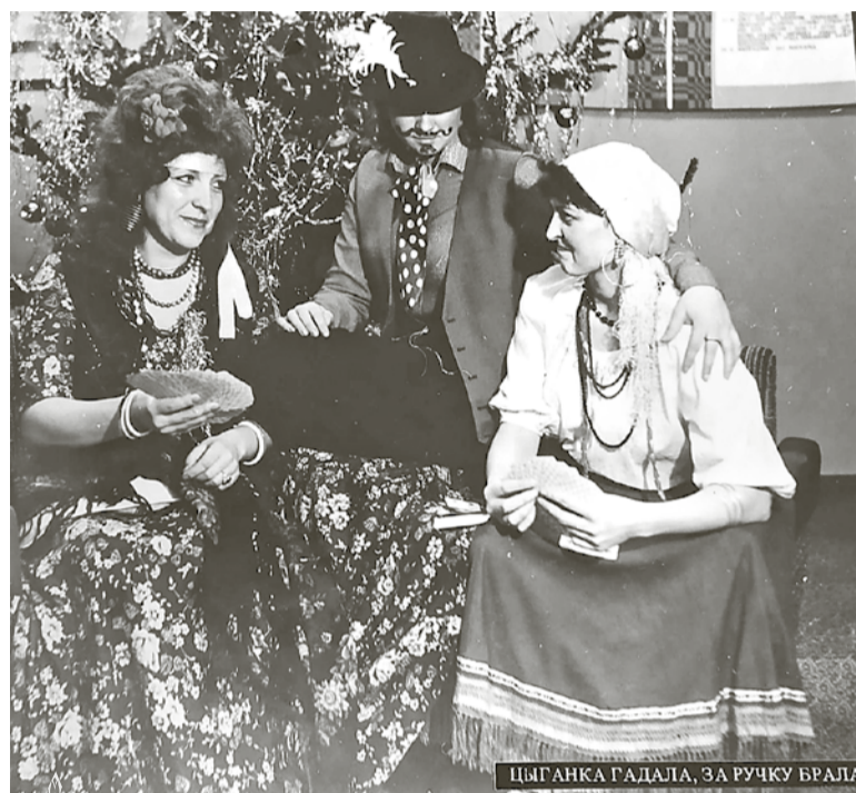
Цыганка гадала, за ручку брала

— Помнится, проводили конкурс с участием нескольких команд. Каждая должна была представить своего Деда Мороза и Снегурочку. Так вот во внучек Мороза переоделись мужчины; пригодились свадебные платья жен, а кокошники сделали из ваты. Было необычно и весело.